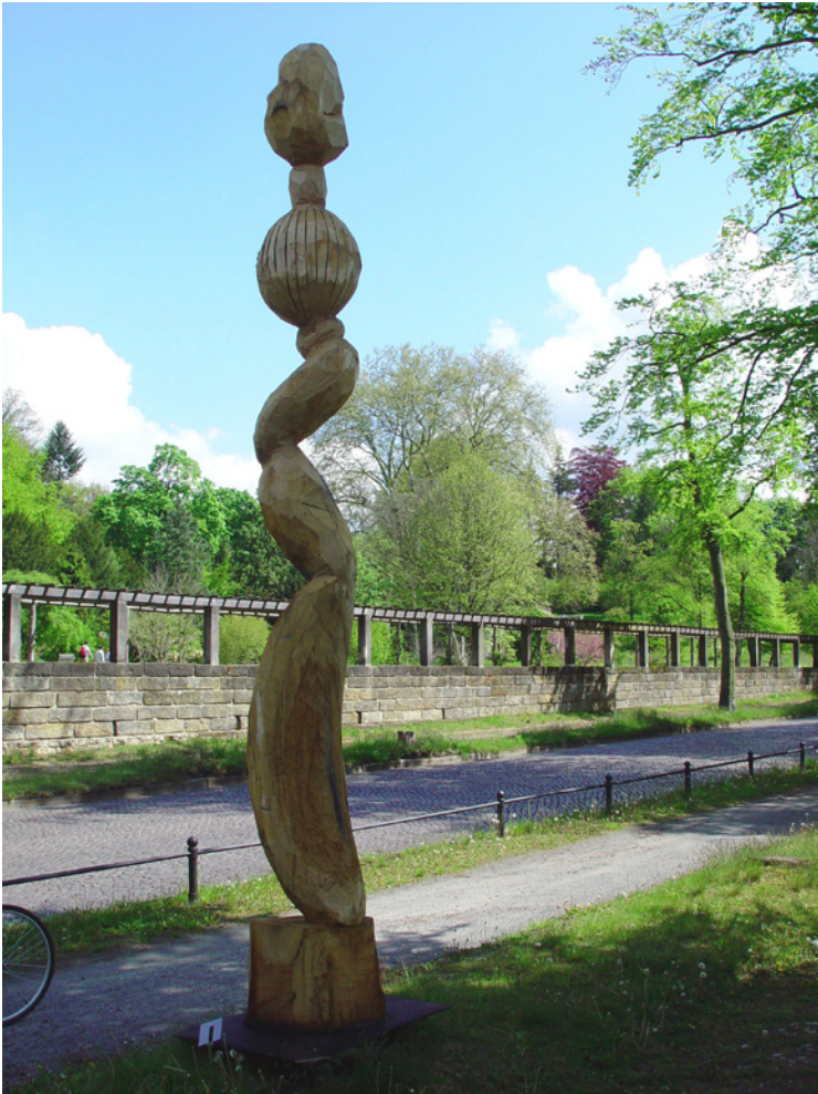
Volker Nickel „Monadenkomposition/ Eiche“ am Botanischen Garten Potsdam, 2005 488 x 65 x 56 cm

In den Bildhauerwerkstätten Berlin wurde ich beim Bauen und Installieren von kleinen objekthaften Stuhlmodellen zum erstmalig von einem jungen angehenden Doktoranden der Philosophie angesprochen, als er meine neuen Einstückskulpturen nebeneinander sah.